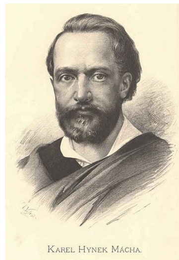
KAREL HYNEK MÁCHA.